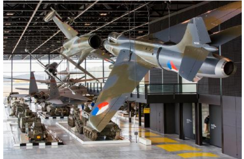
De dog fight.