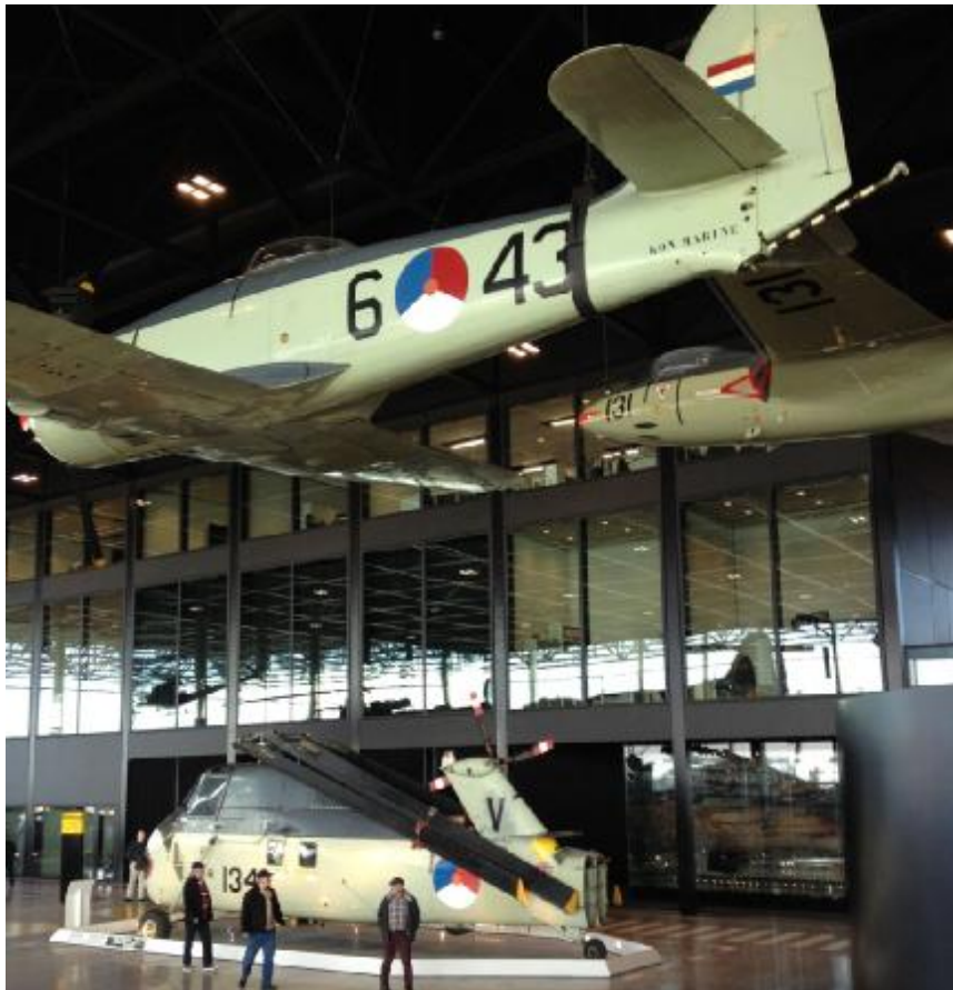
Het MLD-erfgoed is ook nadrukkelijk aanwezig.

Het NMM is, net als het Marinemuseum, vrij toegankelijk met uw veteranenpas of Museumjaarkaart.